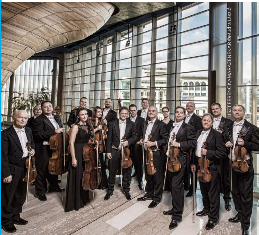
LISZT FERENC KAMARAZENEKAR