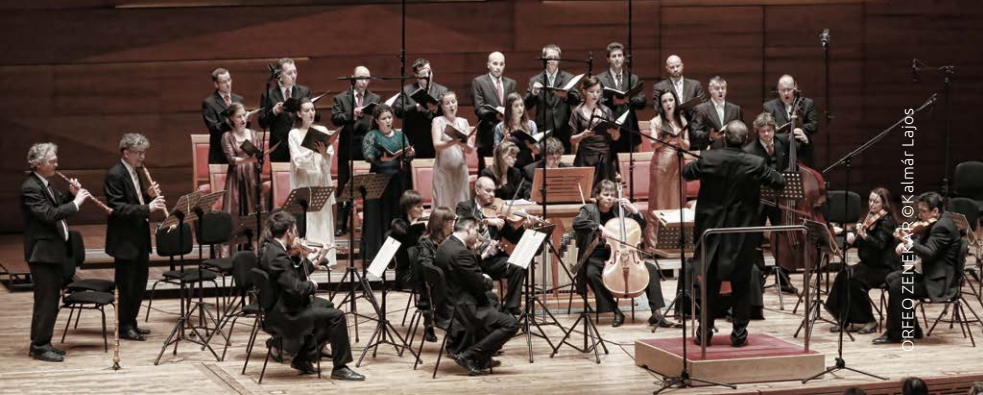
ORFEO ZENEKAR