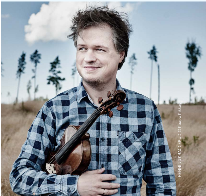
HENNING KRAGGERUD