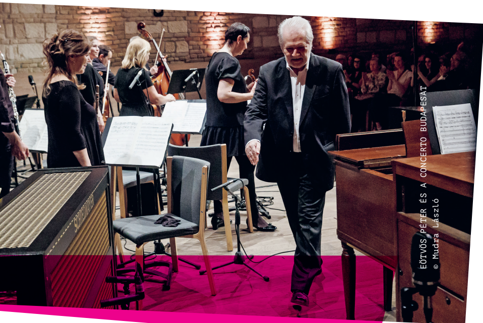
EÖTVÖS PÉTER ÉS A CONCERTO BUDAPEST