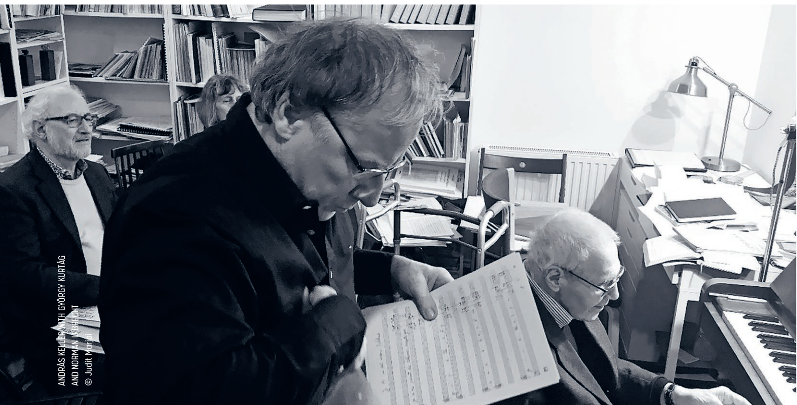
ANDRÁS KELLER WITH GYÖRGY KURTÁG AND NORMAN LEBBECHT

Continuing along this path, they take to the stage in six cities across the United Kingdom in 2023, in order to further cultivate and disseminate Hungarian classical music traditions worldwide.