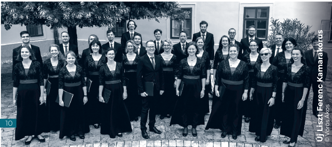
Új Liszt Ferenc Kamarakórus

April 3, 2026 Friday 19:30 Liszt Academy