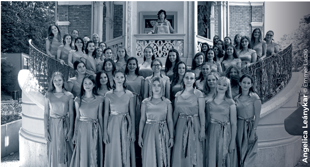
Angelica Leánykar © Emmer Laszlo